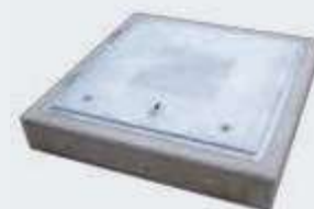
Abdeckung LW 80 / 80 cm bodeneben