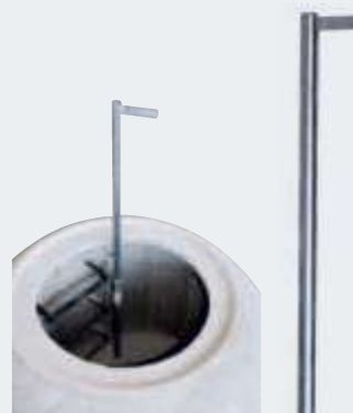
Einstiegshilfe für Schachthals DN 1000 mit optimierten Einstieg