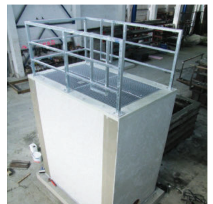
mit verzinktem, 3-seitigem Absturzgeländer