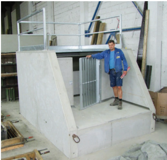
mit schwenkbarem Einlaufgitter