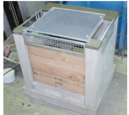
mit 3-seitigem Notüberlauf und Treibgutschutz durch Wellengitter