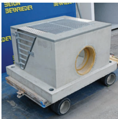
mit klappbarem Grobrechen in Sonderform