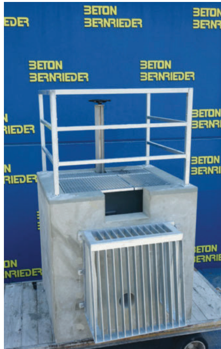
mit Zulaufschutzkorb und Schieber mit Handrad