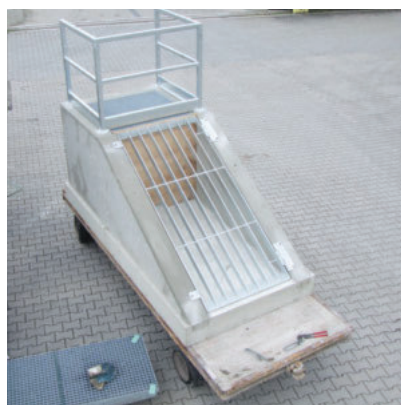
mit Grobgitter und Absturzgeländer