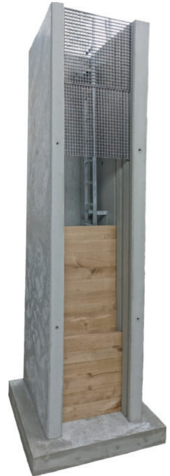
mit 3 Nutenpaaren für Staubretter und Einlaufgitter