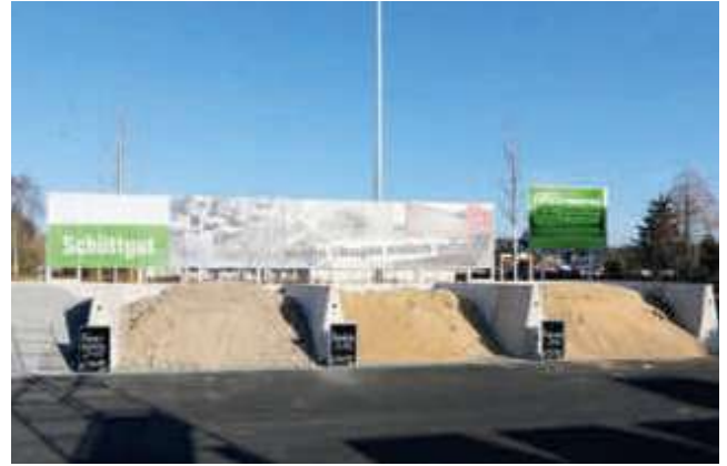
Schüttgutboxen mit aufgeschraubten Tafeln für Werbung oder Materialbezeichnung.