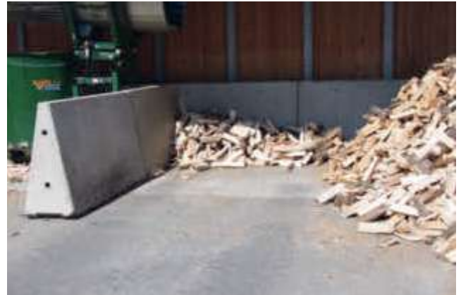
Trennwände zur Lagerung von Holzschichten