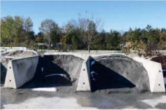
Schüttgutboxen 122 cm hoch zum Trennen von verschiedenen Gesteinskörnungen.