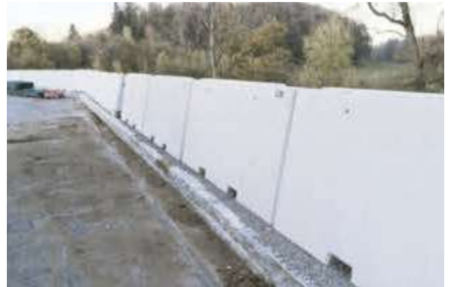
Stellwände Grundteile mit 2 Stapleraussparungen 20/10 cm