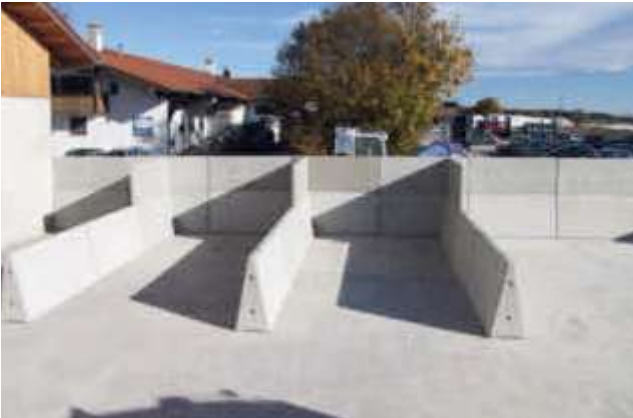
Trennwände 224 cm hoch mit erhöhter, hinterer Wand als Überschubschutz.