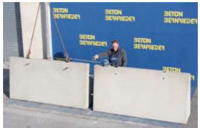
Zusammenziehen der Trennwände mit Kettenzug oder Spanngurt beim Versetzen.