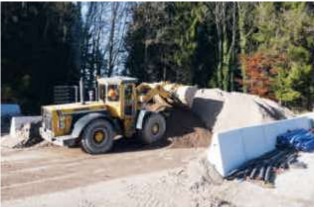
Schüttgutboxen für Golfplätze