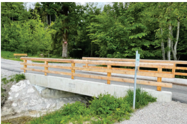
83052 Bruckmühl OT Mittenkirchen