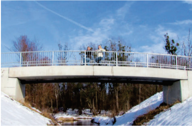
83053 Raubling/Litzldorfer Bach