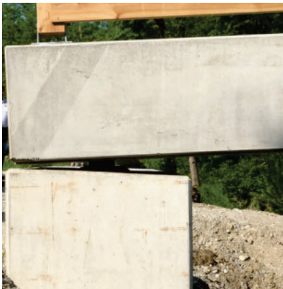
...auf Fundamente mit Brückenlager