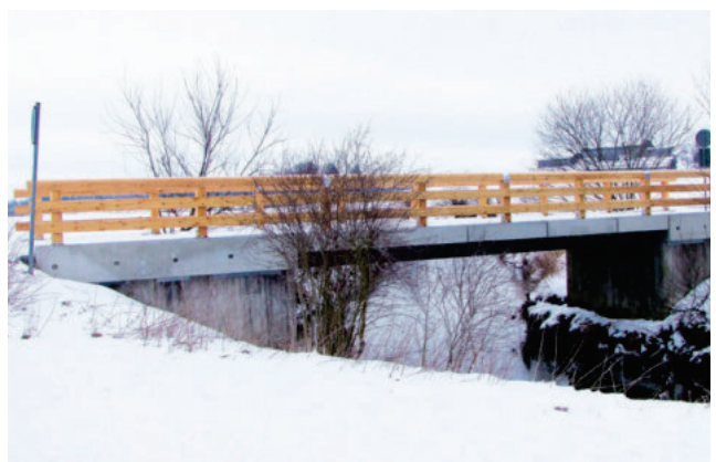
83043 Bad Aibling, Glonnbrücke bei Holzhausen