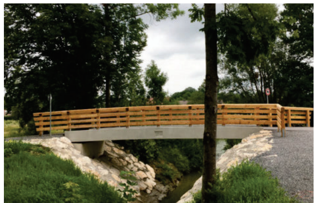
und optisch ansprechendem Lärchengeländer