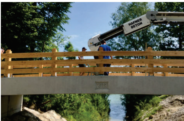
Brückenplatte mit Überhöhung, Jahreszahl