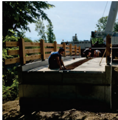
Plattenstoß mit Verschlaufung