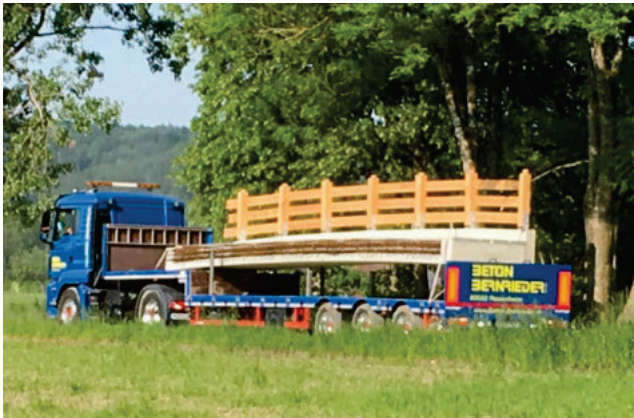
Anlieferung mit dem Tieflader