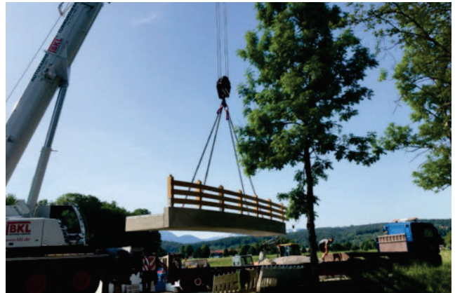
Versetzung mit dem Autokran...