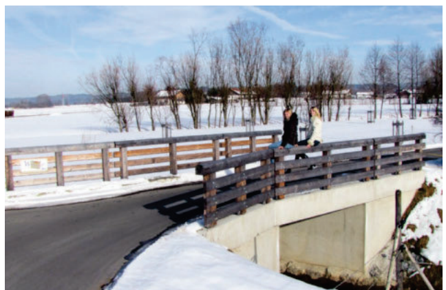
83115 Neubeuern OT Winkl/Angermühlbach