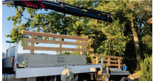
Anlieferung der kompletten Brückenplatte