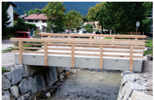
82487 Oberammergau/Brücke über die Große Laine