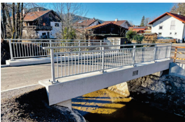
83101 Rohrdorf OT Achenmühle